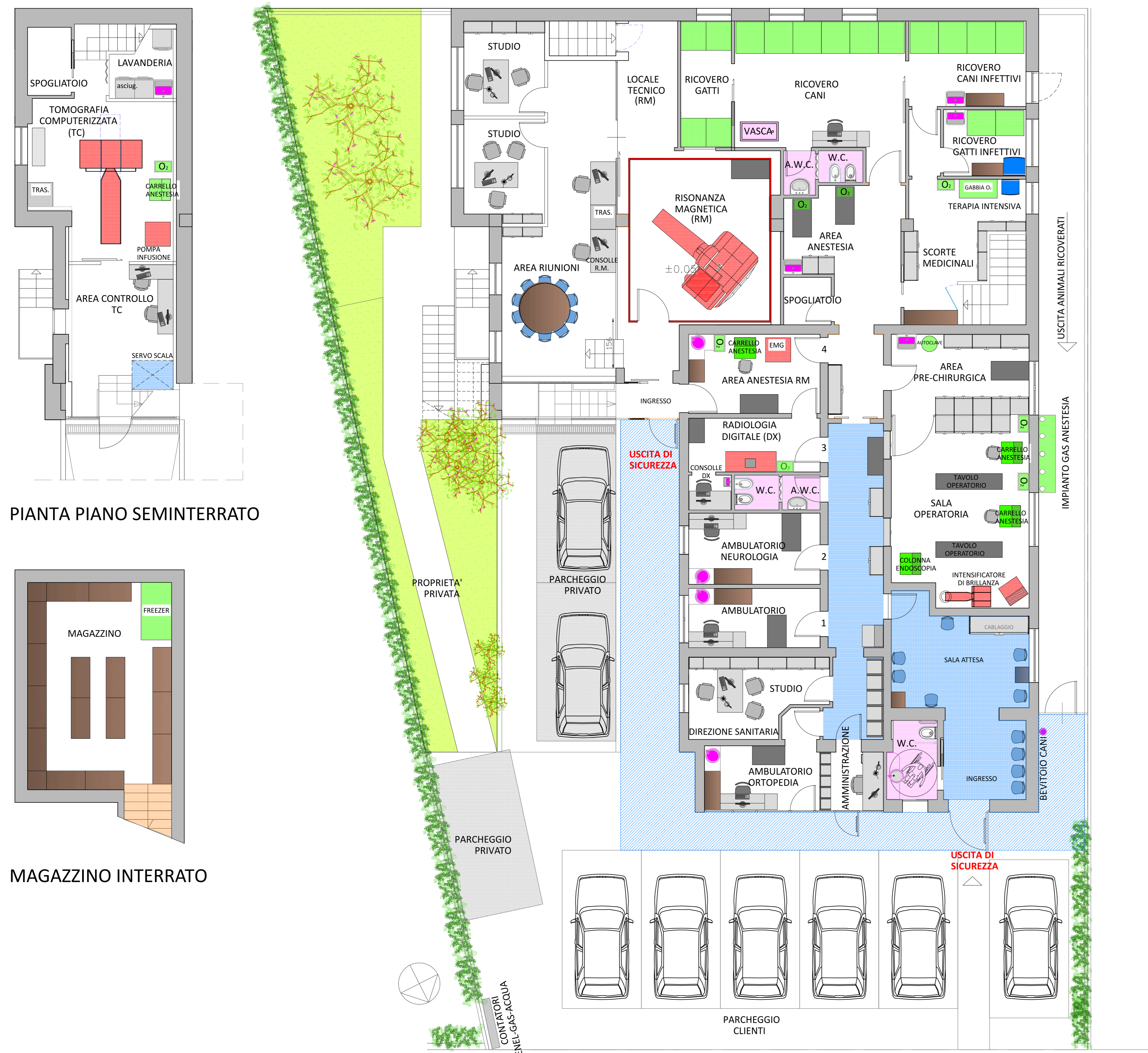
PIANTA PIANO SEMINTERRATO